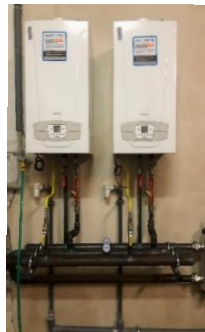
Výměna plynových kotlů