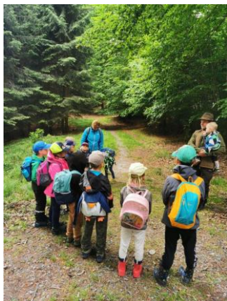
Den s lesníkem