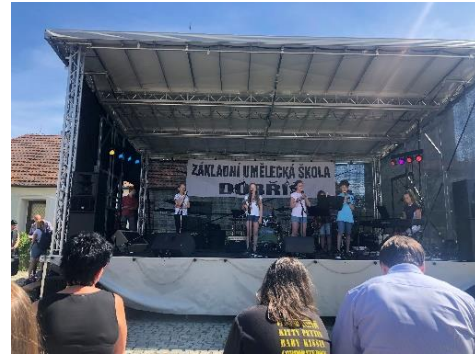
Akce města Dobříš . vystoupení školní kapely