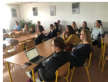
Beseda – Bezpečný internet