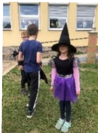
Čarodějnice ve školní družině