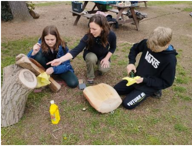
Rozvrhové téma – Stromy Gama