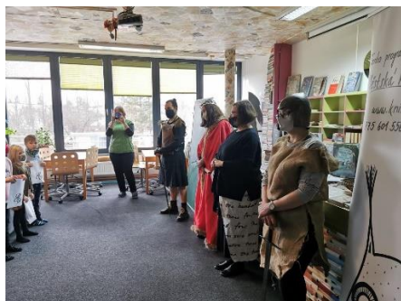
Pasování na čtenáře