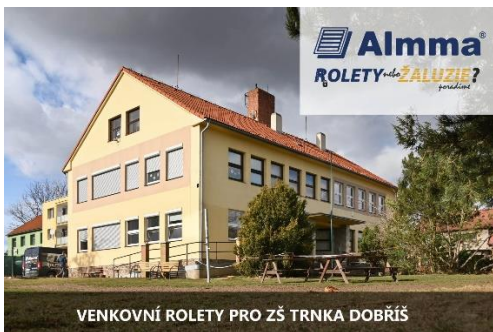
Instalace venkovních žaluzií