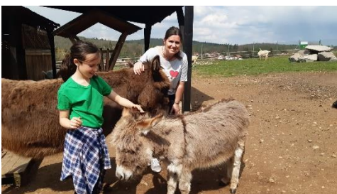
Farma Jedné ženy

Oblastní kolo recitační soutěže ve Strži