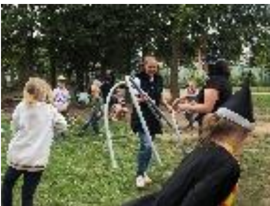
Den dětí ve školní družině