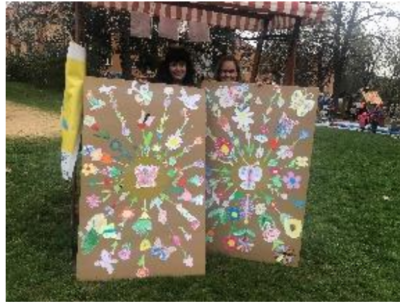
Den Země – Rozkvetlá Dobříš