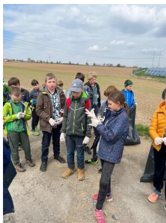
Den Země ve škole