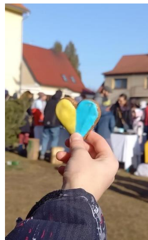
Charitativní snídaneň pro Ukrajinu