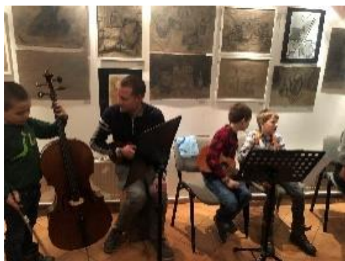
Vernisáž žáků ZŠ TRNKA – „Zatíší“