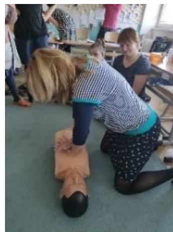
Letní pracovní setkání pedagogů Seminář Vedení dětí k odpovědnosti První pomoc - pedagogové