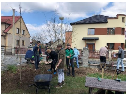
Brigády s rodiči