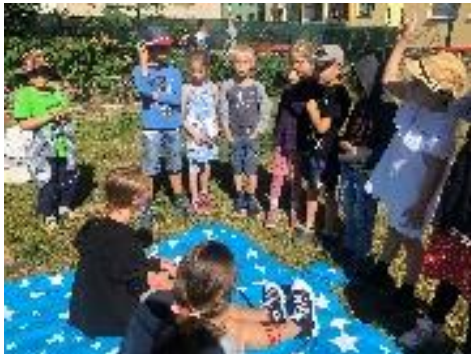
První pomoc pro žáky