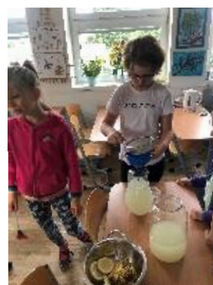
Výroba bezové limonády

Při škole byl v tomto roce zřízen školní klub, který navštěvovali žáci 5. ročníku a druhého stupně.