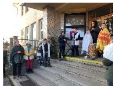
Vánoční scénka – 2. třída