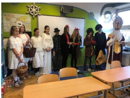
Mikuláš ve škole