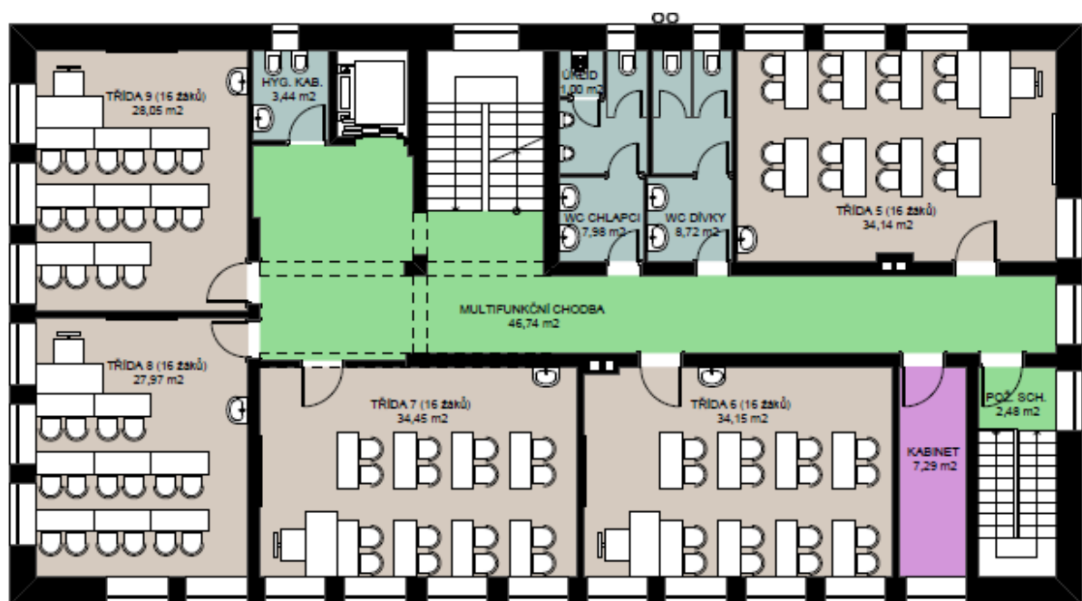
půdorys 1. patro